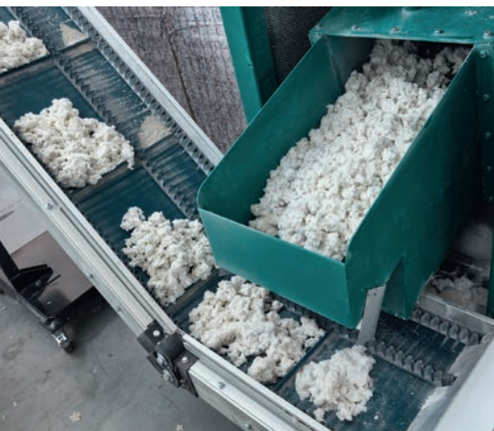
Der Zellstoff- unwiederbringlich zerlegte Akten und Rohstoff zugleich