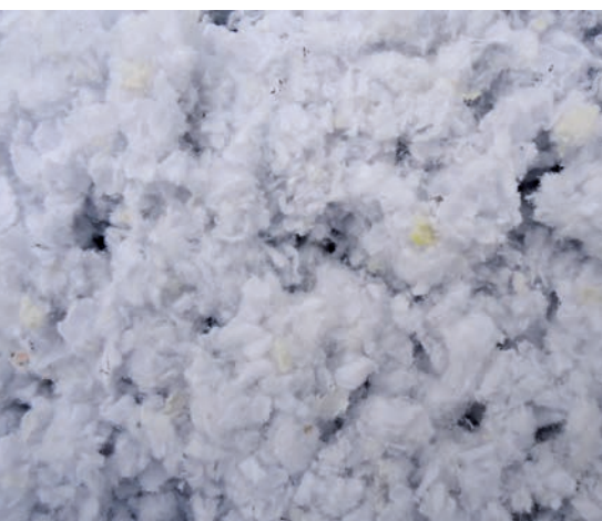
Die Aktenvernichtung im Vergleich- handelsüblich (oben) und von AEROCYCLE (unten)

Sicherheit und Garantie sind entscheidende Schlüsselfaktoren bei der Vernichtung vertraulicher oder gar geheimer Akten. Die bekannten Ergebnisse auf derzeitigem Stand der Technik sind nicht optimal, da das Endprodukt rekonstruierbar ist. Hier geht unser neu entwickeltes, patentiertes Verfahren der Fiber-Refreshing-Technology weiter, weil die Akten unwiederbringlich zerlegt werden. Das maschinelle Herzstück ist die FRT-AEROMILL®, in der komplette Aktenordner zu watteartigen Fasern werden.